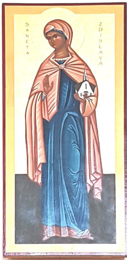
Ikona svaté Zdislavy v kostele v Prostřední Bečvě